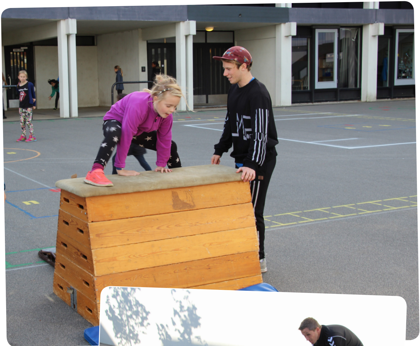
En instruktør fra Aarhus Parkour medvirker til at planlægge og igangsætte ESAA Kids-forløbet 'parkour'.