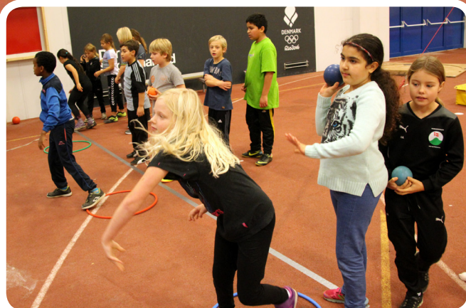
Fotos fra afslutningen på ESAA Kids-forløbet 'løb/spring/kast': Atletik-arrangement i Marselishallen.

“Efter de fire uger er det tydeligt at se en udvikling, særligt blandt eleverne i mellemgruppen og dem, der har sværest ved det. I atletik lærer man at tage udgangspunkt i og kæmpe med sig selv. Når eleverne flytter sig, er det en kæmpestor tilfredsstillelse.”