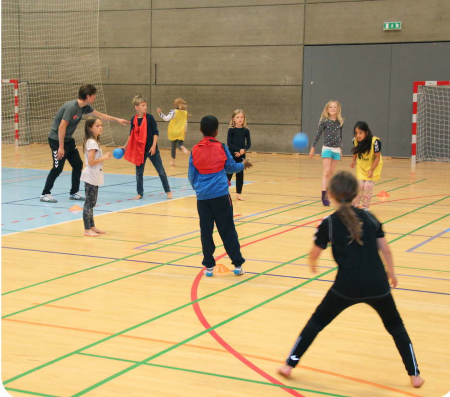
En træner fra AGF er med i ESAA Kids-forløbet 'boldspil'.