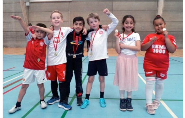
Vinder blandt 0.-1. klasserne: Målnæserne fra 1.B