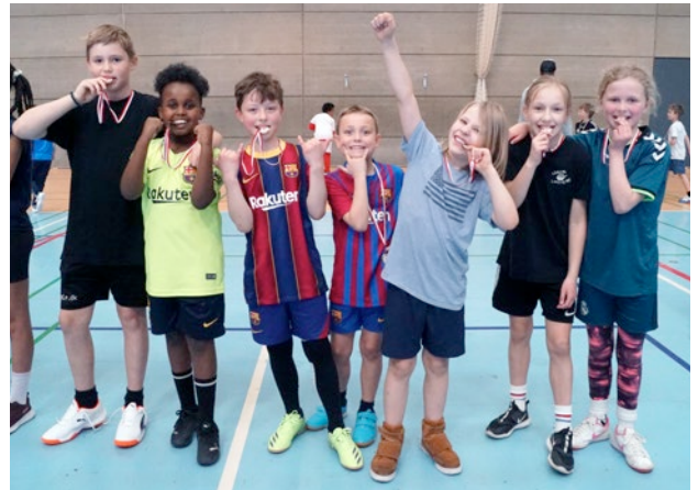
Vinder blandt 2.-3. klasserne: 3.A