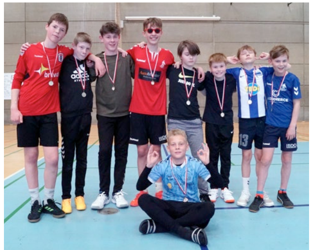
Vinder blandt 4.-7. klasserne: 6. årgang